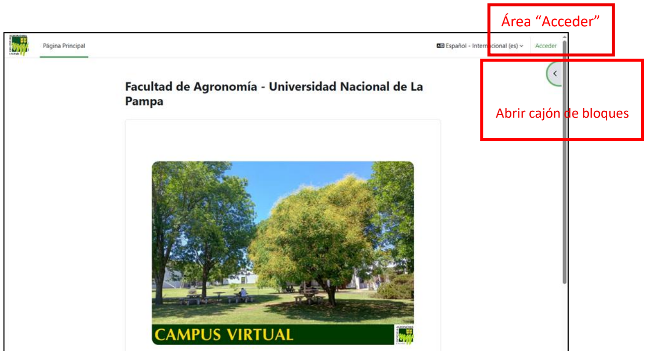
Figura 1: Acceso al campus virtual https://v5.campus.agro.unlpam.edu.ar

Para ingresar al campus virtual, acceda a https://v5.campus.agro.unlpam.edu.ar