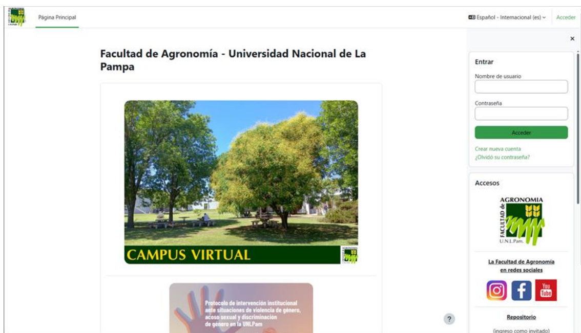
Figura 2: página principal con "Cajón de bloques" a la derecha.